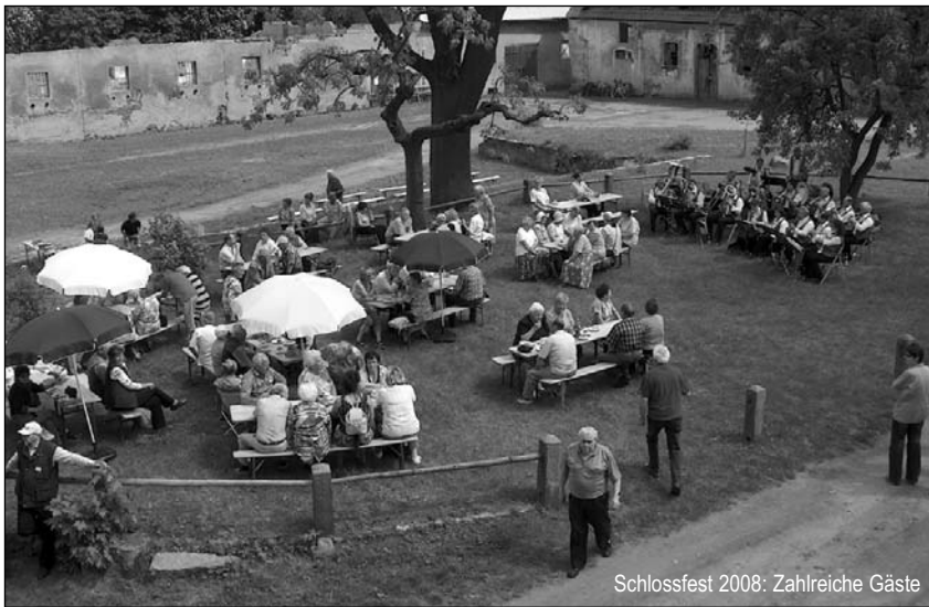
Schlossfest 2008: Zahlreiche Gäste