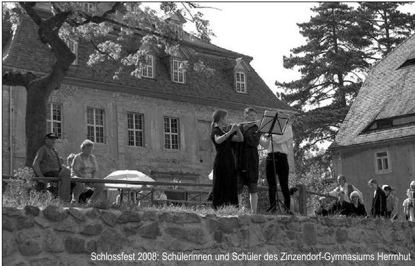
Schlossfest 2008: Schülerinnen und Schüler des Zinzendorf-Gymnasiums Herrnhut