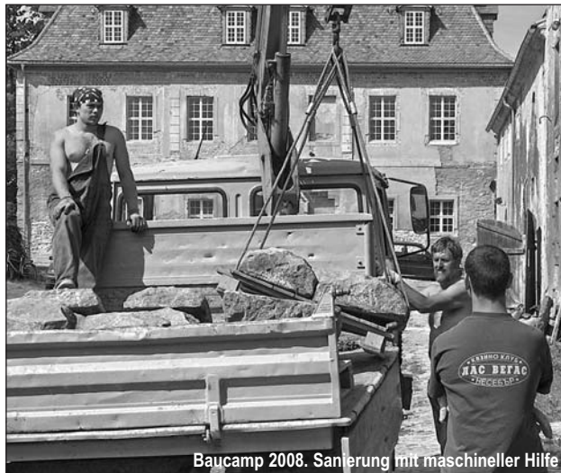
Baugcamp 2008. Sanierung mit maschineller Hilfe

Mitte August 1722 berichtete Heitz erstmals explizit über konkrete Bauarbeiten in Berthelsdorf, die nach Vollendung des Ziegelbrandes in Angriff genommen werden sollten. Er hofft, »daß mit Gottes Hülffe, diesen Herbst oben 5 Zimmer vor gnädigste Herrschaft sollen wohnbar gemacht werden.« Es blieb aber wohl nur eine Hoffnung. Immerhin war das Erdgeschoss hergerichtet geworden. Es enthielt vermut-