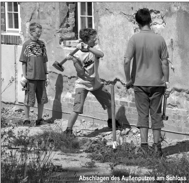
Abschlagen des Außenputzes am Schloss

Es ist unser Anliegen, Jugendliche aus verschiedenen Ländern einander näher zu bringen. So wurden Gruppen gebildet, in denen Jugendliche aus ver-